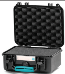
* cubed foam