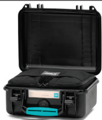
* interior bag