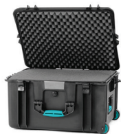
* cubed foam