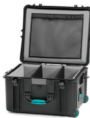
* soft padded open deck + dividers