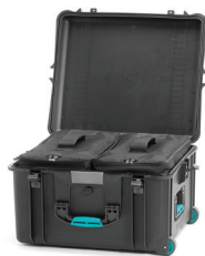
* interior bag